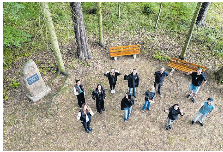
Die Schüler peppten den Platz im Wald auf.